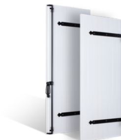
VOLETS BATTANTS 27mm à PENTURES ET CONTRE-PENTURES en PVC EN SAVOIR PLUS