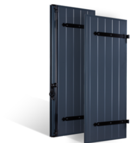
VOLETS BATTANTS 30mm à PENTURES ET CONTRE-PENTURES en ALUMINIUM EN SAVOIR PLUS