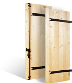
VOLETS BATTANTS 27mm à PENTURES ET CONTRE-PENTURES en BOIS EN SAVOIR PLUS